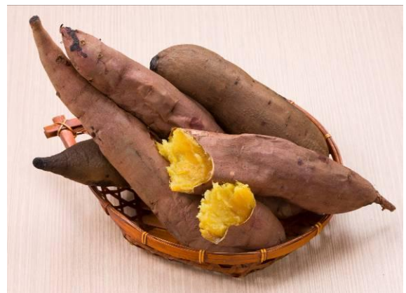
●茨城県産 シルクスイート 4.5kg／3,600円（税抜）

日本屈指の野菜を扱う京都南部青果市場で、経験に裏打ちされた確かな目利きで評判の青果卸売会社「京印京都南部青果」とコラボレーション。「京印」のバイヤーが推薦する野菜や果物をラインナップします。「京印」だから確保することができた、上品な甘さと絹のような舌触りが特長の、希少なさつま芋の新品種「シルクスweet」と、同社バイヤーがセレクトした梨を4品種発売します。