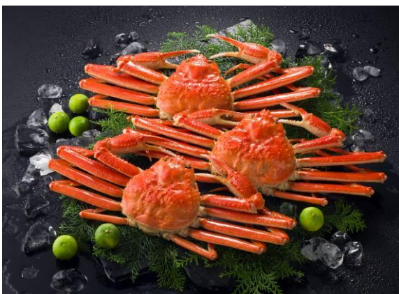
●船凍ボイルずわいがに姿（3尾） / 7,980円（税抜）