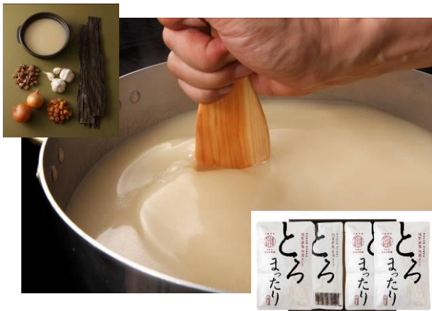
●「侘家古曆堂」白濁スープ とろまったり ／3,000円（税抜） 内容量：500g×4袋 冷凍

素材を活かした料理の数々で、体にやさしい味を好む京都の食通たちをうならせている料理屋・侘家古曆堂。日本全国から集めた天然素材を使い、旨みを凝縮した白濁スープ「とろまったり」や、同スープで作るかしわ汁そば、自社ブランド鶏「詫家鶏」を使った白レバーのパテ、そぼろ味噌など、名店の味をそのまま自宅でも再現できます。