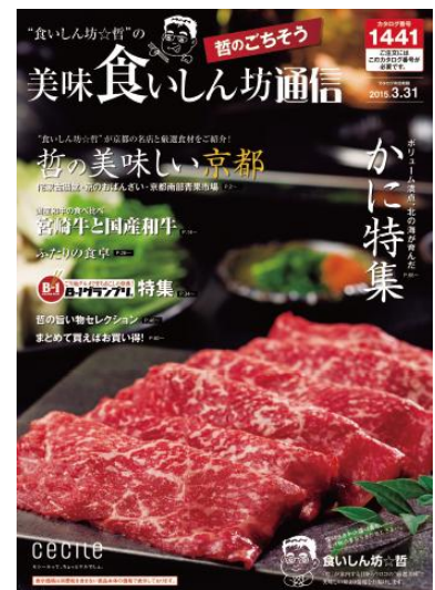
表紙では、宮崎牛を紹介

その他、「哲の美味しい京都」と題した、京都の名店の味や厳選食材の紹介や、食べきりサイズに個包装された冷凍の惣菜や焼き魚を展開する「ふたりの食卓」など、食材から加工食品まで、幅広くラインナップ。また、一般財団法人日本穀物検定協会による25年度米食味ランキングで特A評価を獲得したお米「さがびより」の定期販売も開始します。