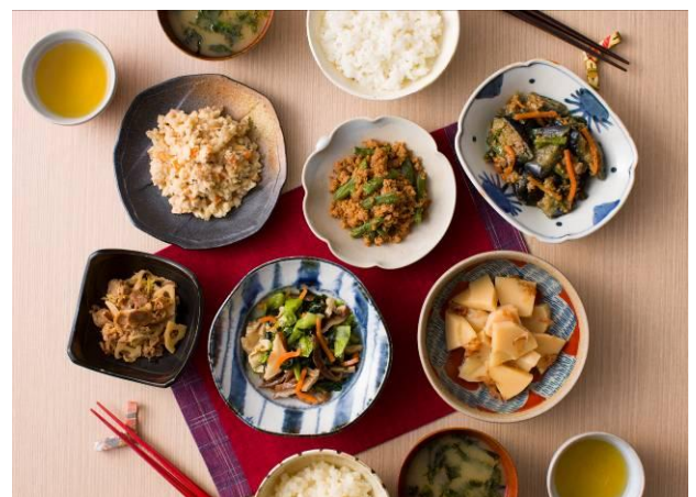
●サツともう一品 和惣菜6種（計12袋）／2,980（税抜）

その他、定番の焼き魚を温めるだけですぐ食べられる、一切れずつ個包装された「簡単焼き魚6種セット」や、油もひかずにフライパンで焼くだけの「イタリアンソース漬け魚3種セット」など、いずれも適量を作るのが難しい時、時間がない時に便利な商品を取り揃えています。