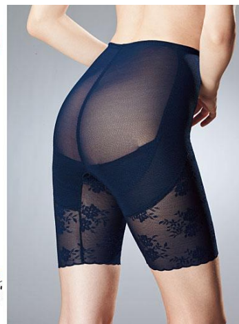
お尻サポートロングガードル S・M・L・LL/2,490円 (税抜)

ヒップと太ももの境目に配したポケット状の裏当てで、ヒップをぐっと持ち上げ、美しいヒップラインを作ります。さらにヒップ回りに幅広く配した裏当てで、キュッと寄せ上がった小尻にメイク。