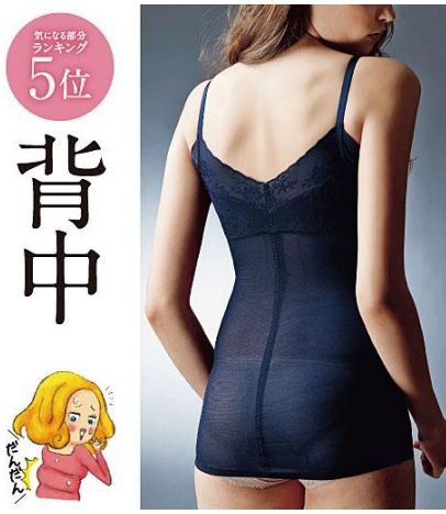
背中まわりサポートボディシェイパー S・M・L・LL/3,990円 (税抜)

ノンワイヤー・モールドカップブラと一体化したボディシェイパー。パワーネットによるラクな着心地で背中と脇の気になるお肉を引き締め、ボディラインをすっきり整えます。