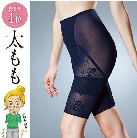
太ももまわりサポートロングガードル S・M・L・LL/2,990円 (税抜)

内ももに付けた幅広の裏当てで、たるんだお肉を引き上げ。もたつきがちな太ももを、すっきりと引き締めます。フロントは、ゴムを付けずにパワーネットの裏当てで広く押さえるようにしました。