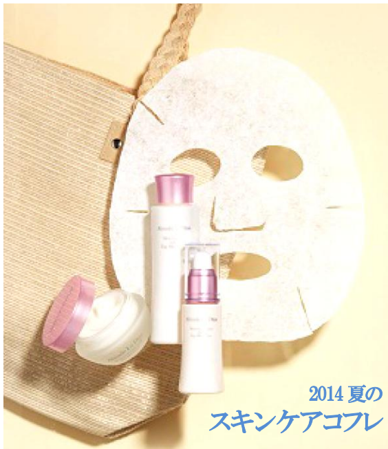
2014 夏の スキンケアコフレ

株式会社デイノス・セシール（本社：東京都中野区）は、「セシール」が展開する、卵の内側に存在する約0.07mmの薄い膜「卵殻膜（らんかくまく）」を配合したコスメブランド「アルマード ラ ディーナ」より、夏の紫外線で破壊されやすいコラーゲンをサポートする力に優れている「卵殻膜」を配合した『2014夏のスキンケアコフレ』と『2014夏のベースメイクコフレ』を、2014年6月2日（月）より数量限定で発売します。