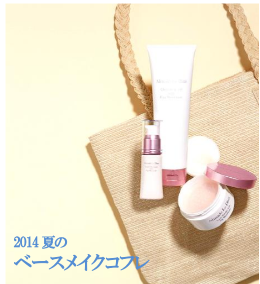
2014 夏の ベースメイクコフレ

今回「アルマード ラ ディーナ」の中でも特に人気のアイテムをセレクトした、夏コフレ2タイプを発売します。